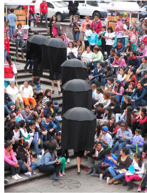
En Zacatecas - Mexico Oct 2014